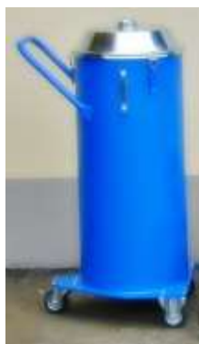
OPTIONAL: FUSTO RACCOLTA POLVERI capacità 110 litri