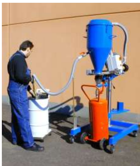
RIEMPIMENTO DI ESTINTORE CARRELLATO